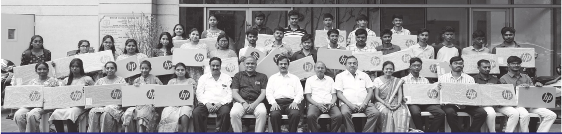
ವಿದ್ಯಾರ್ಥಿ ಮಿತ್ರ ಉಚಿತ ಲ್ಯಾಪ್ಟಾಪ್ ಯೋಜನೆಗೆ ಆಯ್ಕೆಯಾದ ವಿದ್ಯಾರ್ಥಿಗಳೊಂದಿಗೆ ಮಹಾ ಸಭೆಯ ಪದಾಧಿಕಾರಿಗಳು

ವೃತ್ತಿಪರ ಶಿಕ್ಷಣ ಅಂದರೆ ಡಿಪ್ಲೋಮಾ, ಇಂಜಿನಿಯರಿಂಗ್, ವೈದ್ಯಕೀಯ, ಸಿ.ಎ, ಎಂ.ಬಿ.ಎ, ಎಂ.ಸಿ.ಎ, ಇತ್ಯಾದಿ ಇತ್ಯಾದಿ ಕೋರ್ಸುಗಳಲ್ಲಿ ಓದುತ್ತಿರುವ ಆರ್ಥಿಕವಾಗಿ ಹಿಂದುಳಿದಿರುವ ಪ್ರತಿಭಾವಂತ ವಿದ್ಯಾರ್ಥಿಗಳ ಉನ್ನತ ಶಿಕ್ಷಣದ ಕನಸಿಗೆ ಕೈಪೋಡಿಸಿ ಸಹಕರಿಸುವ ವೈಶಿಷ್ಟ್ಯಪೂರ್ಣ ಯೋಜನೆ ವಿದ್ಯಾರ್ಥಿಮಿತ್ರ ಎರಡು ರೀತಿಯಲ್ಲಿ ವಿದ್ಯಾರ್ಥಿ ಸ್ನೇಹಿಯಾಗಿ ಸಾವಿರ ಸಾವಿರ ವಿದ್ಯಾರ್ಥಿಗಳಲ್ಲಿ ಆತ್ಮಸ್ಥೈರ್ಯ ತುಂಬಿ ಸ್ವಾಭಿಮಾನದಿಂದ ಶಿಕ್ಷಣ ಮುಂದುವರಿಸುವ ಶಕ್ತಿಯಾಗಿದೆ.