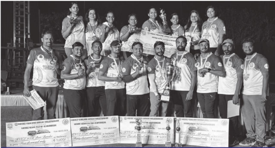
ವಿಚೇತ ತಂಡ ಗೋಲ್ಡನ್ ಟೈಟನ್ಸ್ ಹಾಗೂ ಪದ್ಕ ಸ್ವಾಸ್ಥ್ಯ ಆಟಗಾರರು ಪ್ರಶಸ್ತಿಗಳೊಂದಿಗೆ