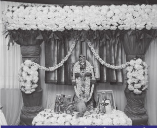
ಶ್ರೀ ವಾಸವಿ ವಸ್ತ್ರಗಳಿಗೆ ವಿಶೇಷ ಪೂಜೆ

ಇದುವರೆವಿಗೂ ಸುಮಾರು 1500ಕ್ಕೂ ಮೀರಿದ ವಿದ್ಯಾರ್ಥಿಗಳಿಗೆ 13 ಕೋಟಿಗೂ ಮೀರಿದ ಬೃಹತ್ ಮೊತ್ತದ ಆರ್ಥಿಕ ಸಹಕಾರ ನೀಡಲಾಗಿದೆ.